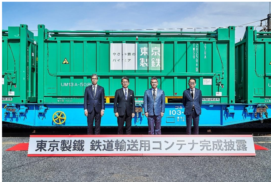
今回新造した無蓋コンテナ (4/21 式典で撮影)

東京製鉄株式会社 (以下「東京製鉄」)、株式会社マルストランスポートーション (以下「マルストランスポートーション」)、日本貨物鉄道株式会社 (以下「J R貨物」)、J R貨物ロジ・ソリューションズ株式会社 (以下「J R貨物ロジ・ソリューションズ」) の4社は、CO2 排出量削減を目的として、鉄スクラップ輸送における鉄道輸送を5月より開始いたしますのでお知らせいたします。